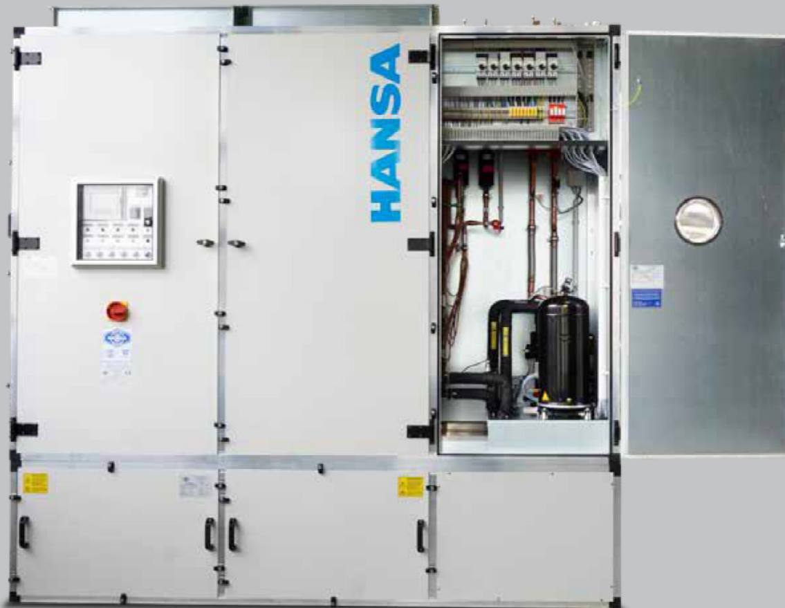
ReCool Line 18-iK mit integrierter mechanischer Kälte